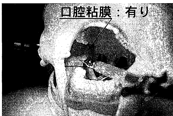
Fig. 4 歯科局所麻酔注射訓練シミュレーションモデル右側下顎孔での下歯槽神経麻酔(下顎孔伝達麻酔, 口内・直達法)