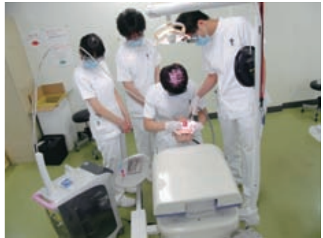
レーザー実習の様子

模型実習ではあるが学生にレーザーに経験させることができ、レーザーを用いたう蝕除去の効率的な技能習熟が可能となったことによりレーザーによる切削原理や機器特性の理解、安全性への考慮を体験し、知識と経験の統合が行えると期待される。