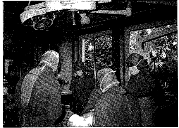
B棟 3 階にある中央手術室

さて、私の留学した大学は Hamburg の中央より北にバスで20分程の住宅地に 100ha位の面積をもったドイツ連邦共和国最大の Hamburg 大学医学部顎外科で名称はUniversität Hamburg Universitäts – Krankenhaus klinik für Kieferkrankheiten Eppendorf (FG-4)と言います。この顎外科だけで東日本学園大学歯学部建物と同じ大きさのものを持っています。A 棟は 4 階建の 100 床を持つ入院棟、B 棟も 4 階建で中央手術室及び外来手術室そして歯科放射線科等があり、C 棟は 5 階建の外来治療室等