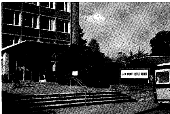
病院入口 (Fig-5にある入口)

勤務時間は朝 7 時 30 分より夕方 4 時まで, 土曜日は休日となっています。昼食時間は 11 時 30 分から 2 時の間ですが, 特に昼食休みの時間はなく, それぞれ手のあいた者から食事に行き, また診療を続けるといった様です。昼食は常勤医員はKieferklinik の地下の食堂で食事ができますが, 研究生, 招聘研究員は, Kieferklinik から往復30分位の所にあるErikahaus (C-3) で食事をします。ただ事務系は12時より 2 時までの昼食休みがあります。診療中には休み時間はありませんが, おもしろいのは, 各自が10時頃になるとKaffee pause と言って30分ほど休憩して, コーヒーを飲み, ケーキ等を食べなが