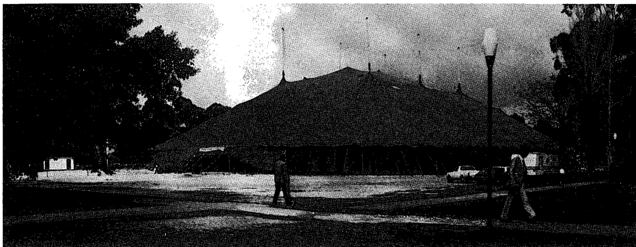
写真 1. テント張りの示説会場全景

ンド(28名)、インドネシア(2名)、イラク(3名)、アイルランド(1名)、イスラエル(11名)、イタリヤ(14名)、日本(256名)、ケニヤ(2名)、クウェート(2名)、マレーシア(4名)、メキシコ(15名)、ニュージーランド(17名)、ナイジェリヤ(14名)、ノルウェー(12名)、パキスタン(3名)、ペルー(2名)、フィリピン(1名)、ポーランド(5名)、ポルトガル(1名)、シンガポール(3名)、南ア(9名)、スペイン(3名)、スウェーデン(25名)、スイス(15名)、タイ(6名)、トルコ(1名)、イギリス(96名)、アメリカ(460)、ソ連(後述)、西ドイツ(101名)、ユーゴ(2名)、ザンビア(1名)、ジンバブエ(1名)。ソ連はオーストラリア政府からの入国ビザが発給されず参加者はゼロであった(参加予定者 41 名)。これに対して、中国(中華人民共和国)の比較的多数の参加が特筆される。