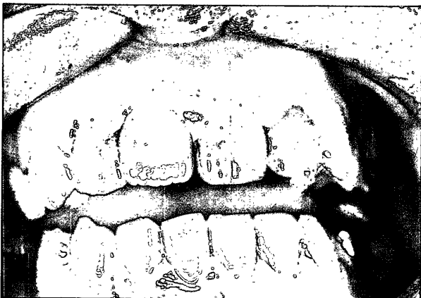
写真5. 初診時 12に変色が認められる