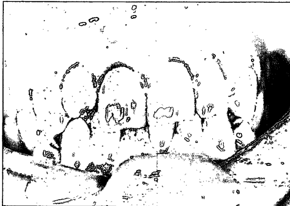
写真3. 初診時 1に変色が認められる