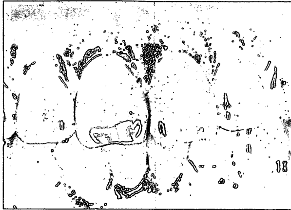
写真1. 初診時 1に変色が認められる