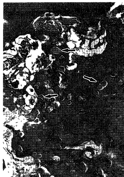
写真 5 (写真 4 の強拡大)

歯根に接して不整形な硬組織が認められる。(Elastica van Gieson染色, ×34)